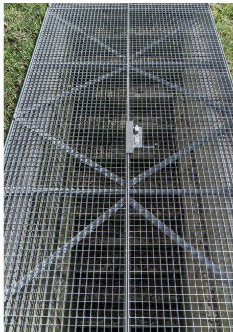
Die nach aussen öffnenden Flügel weisen Längen von mehr als drei Meter auf.

dimensionieren und auszubilden. Damit das Gelände dreiseitig schliesst - ebenfalls eine Anforderung -, wurden auf der Kurzseite mit Absturzhöhe, einzelne sich horizontal streckende Edelstahlseile an den Flügeln befestigt. Beim Öffnen der Flügel strecken sich die Seile und bilden so eine Abschränkung. Um im geschlossenen Zustand ein störendes Durchhängen der Seile zu vermeiden, ist auf der Innenseite ein entsprechender Auffangkorb