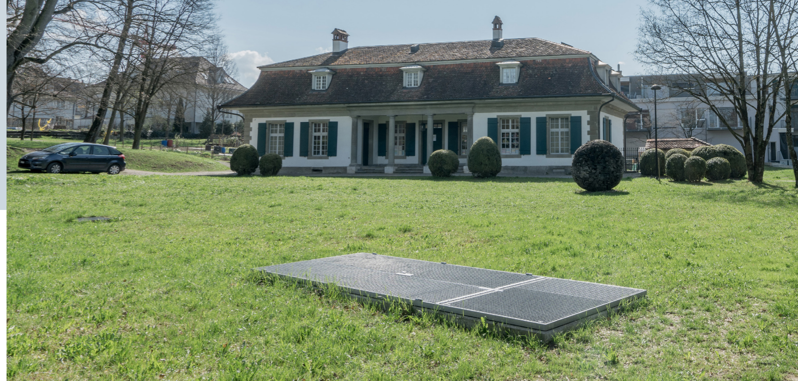
Die beiden Flügel sowie das Festteil sind aus Gitterrosten gefertigt.

angebracht worden. Eine weitere Besonderheit bildeten die Flügellängen von mehr als drei Metern. Abmessung und Eigengewicht erforderten eine erhöhte Stabilität, welche durch das Einschweissen von Diagonalstreben erreicht wurde. An diesen diagonalen Verstrebungen sind auch die Seile und die