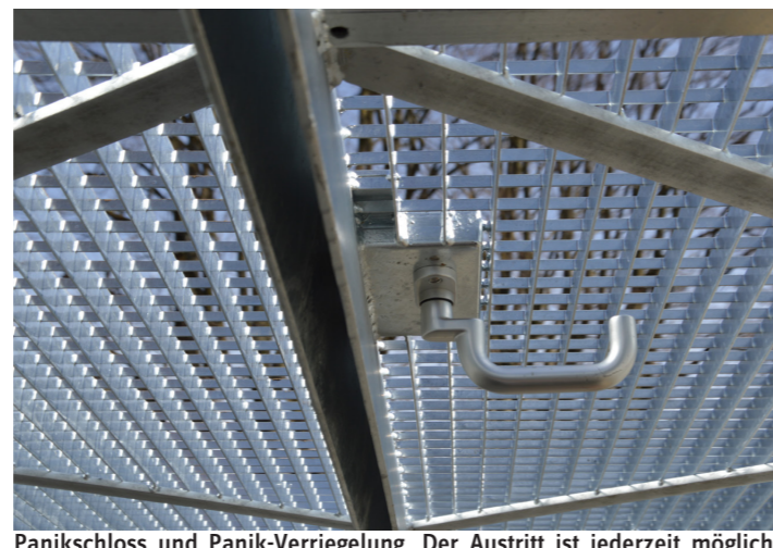
Panikschloss und Panik-Verriegelung. Der Austritt ist jederzeit möglich. Unten dient ein Drücker als Bedienelement.