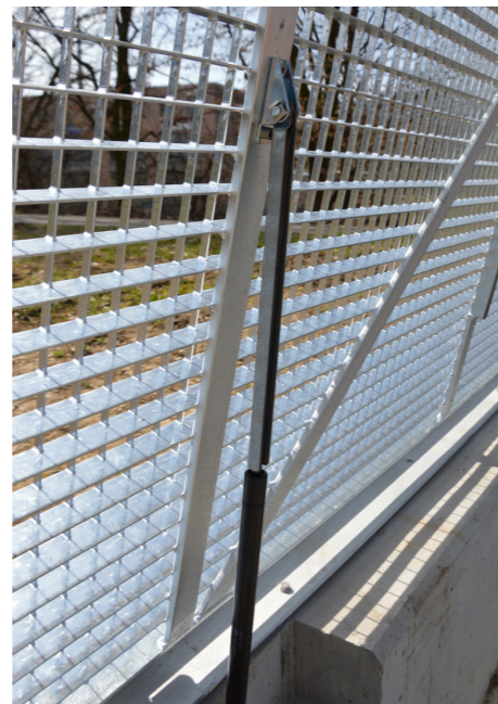
Gasdruckfedern dienen als Öffnungshilfe und Stabilisator.